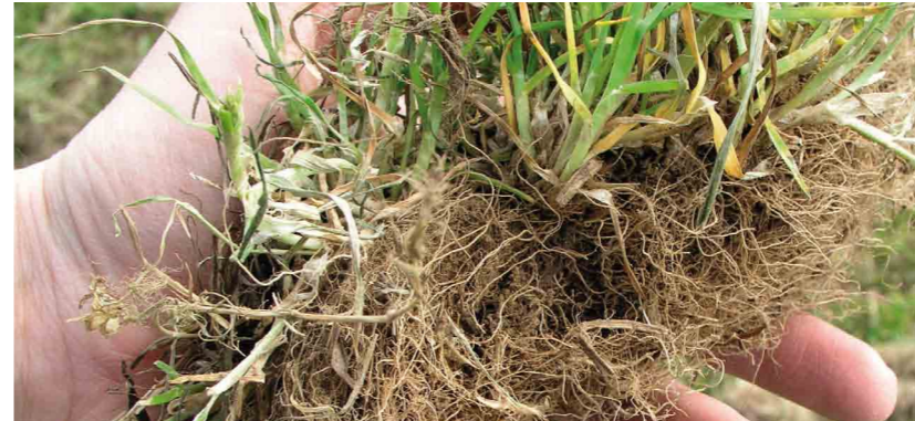
... et le pâturin commun