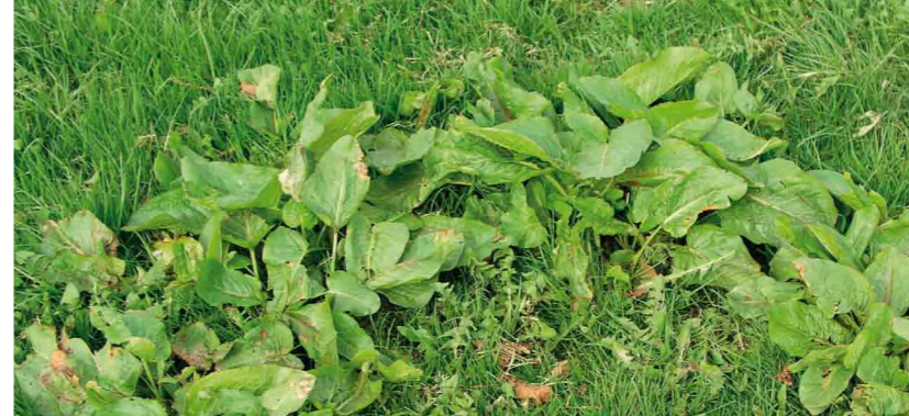
Particulièrement redoutés : Les polygonacées ...