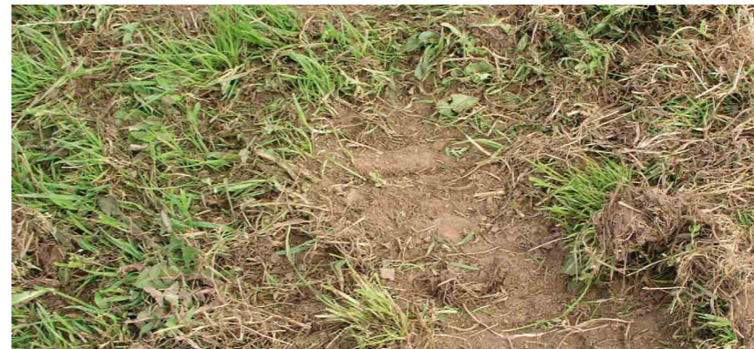
Défauts de repousse d'herbe après années sèches